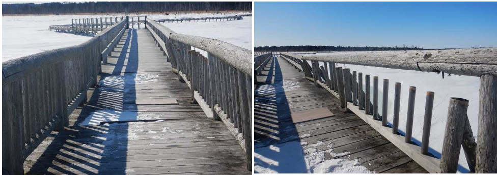
2021年第2週 春国岱木橋の破損を確認