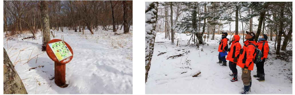
2020年第1週 東梅自然学習林