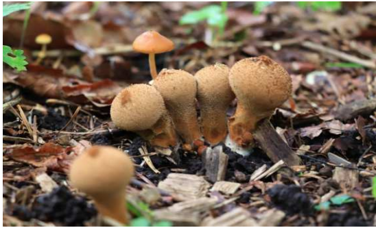
2019年第1週 東梅自然学習林