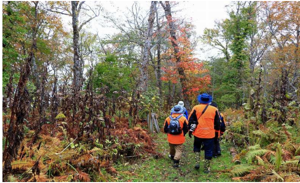
2019年第3週 東梅自然学習林