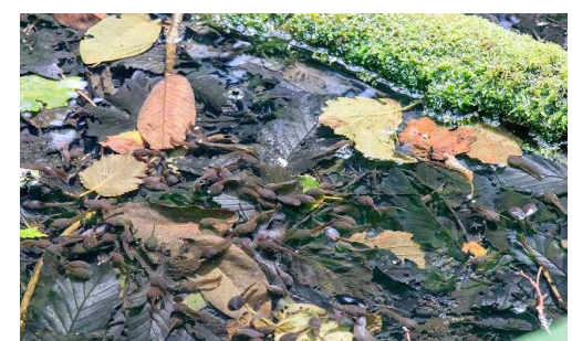
2022年第3週 東梅自然学習林