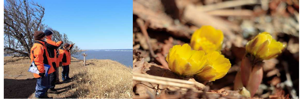
2021年第4週 東梅自然学習林