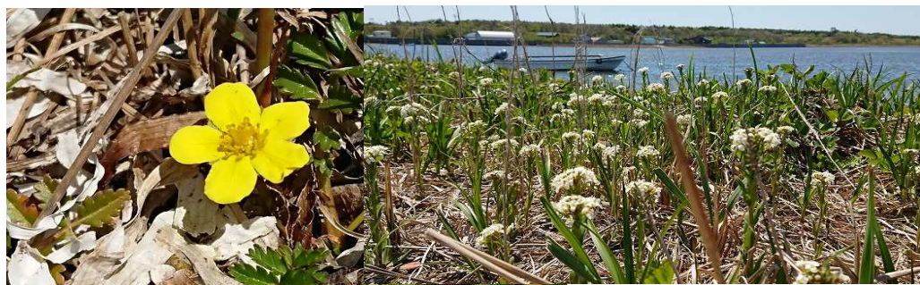
2020年第5週 春国岱