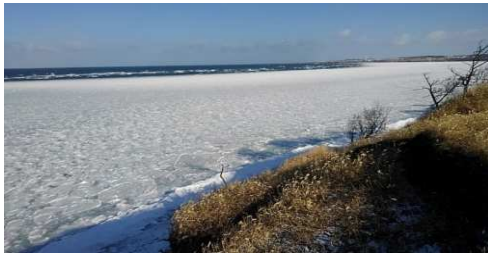
2019年第3週 東梅自然学習林