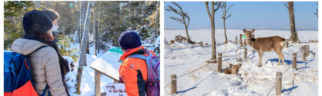
2023年第1週 春国岱ガイド(観察記録なし)