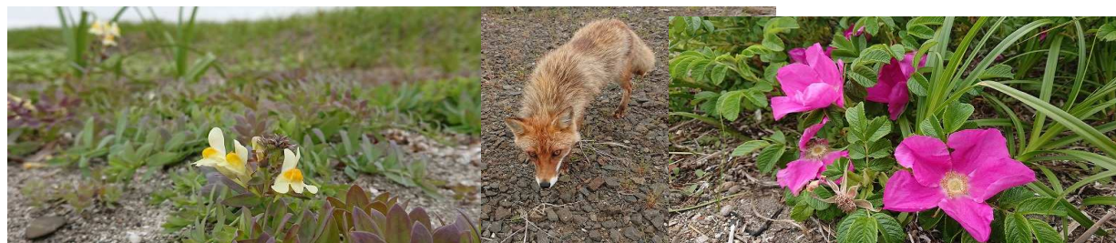
2021年第3週 春国岱(会員 個人散策にて撮影)